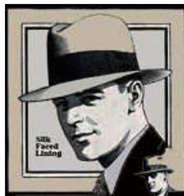
Myös hyvä hattu

Juhlapukuna pidettiin frakkia, liiviä ja silinteriä, mutta arkipuvun kanssa saattoi pitää olkihattua tai lätsää. Salakapakaan täysin uskottavan pukeutumisen saavuttaakin esimerkiksi suorilla housuilla, kauluspaidalla, henkseleillä ja lätsällä. Kieltolain aikaan hatun pitäminen oli yleistä ja sen piti sopia pukuun. Keppi ei ollut tavaton näky, ja usein kauluskin oli frakin kanssa ylhäällä, jotta saavutettaisiin mahdollisimman dandy ulkomuoto. Kravatit olivat joko mustia, valkoisia tai art deco –kuvioisia.