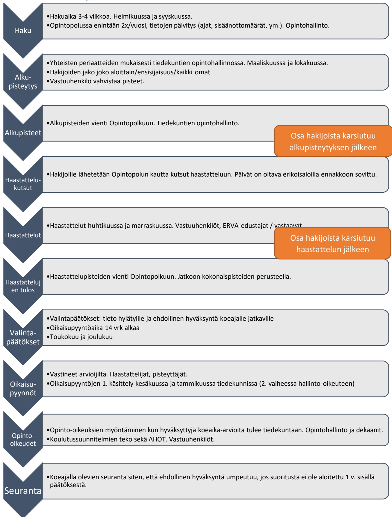
Kaavio 3: Valintamenettelyn kokonaisuus, tehtävät ja toimijat.